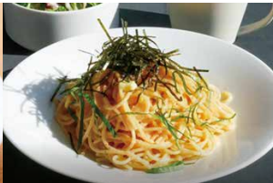
明太子バターと 大葉の Pasta