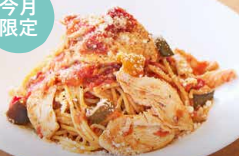
チキンと旬野菜の アラビアータ