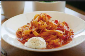
赤ワインとバターで 煮込んだポロネーゼ (マスカルポーネ+100)