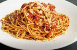
スモークチキンの トマトバジル