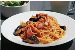
ホエー豚のベーコンと ナスのトマトソース