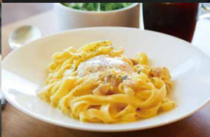
半熟卵の カルボナーラ